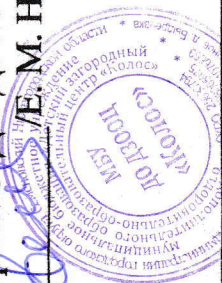
График работы кружков в МБУ ДО ДЗОЦ "КОЛОС"